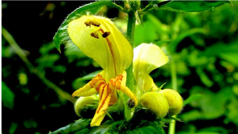
Gele dovenetel - Lamium galeobdolon

Brede wespenorchis, cycлаam, herfststijloos, rode aardster, bosrank, groot springzaad, klein kaasjeskruid, hедера, gevlekte aronskelk, beklieerde duizendknoop, perzikkruid, schildereprijs, vertakte leeuwentand, gele plomp, eikvaren, akker vergeet-mij-niet, timoteegras, slanke sleutelbloem, speenkruid, speerdistel, tormentil, schapenzuring, gewone klit, zilverschoon, akkermunt, gele lis, kruldistel, bitterzoet, veerdelig tandzaad, bezemkruid, blauw glidkruid, donkersporig bosviooltje, maarts viooltje, waterpeper, vlasbekje, knopkruid, paarse dovenetel, Grote parasolzwam, elfenbankje, vliegenschwam, echte tonderzwam, gewone zwavelkop, zwavelzwam, gele trilzwam, grote oranje bekerzwam,