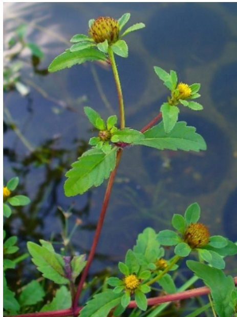
Veerdelig tandzaad ( Bidens tripartita )

https://www.floravannederland.nl/planten/gele_dovenetel