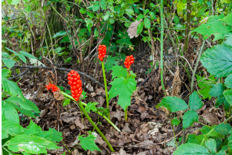
Gevlekte aronskelk ( Arisema maculatum )

https://fleurenflower.nl/aronskelk-giftig/