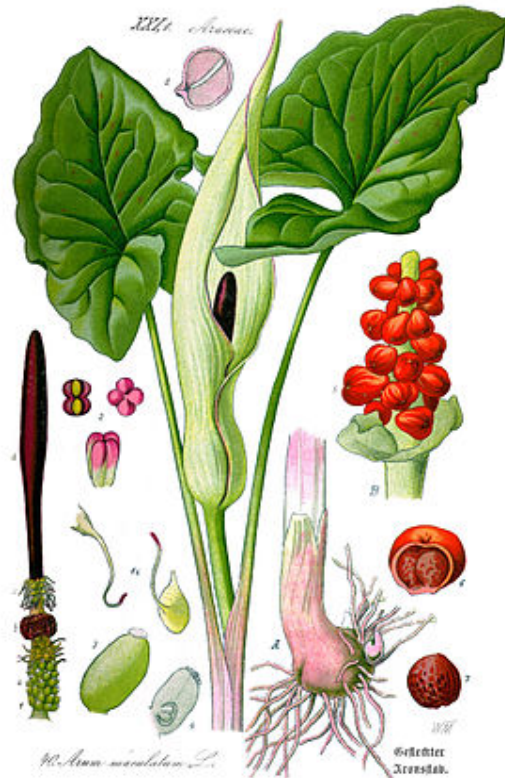
Gevlekte aronskelk ( Arum maculatum )

De bloem geeft warmte af en verspreidt geuren van uitwerpselen om kleine vliegjes aan te trekken die voor bestuiving zorgen.