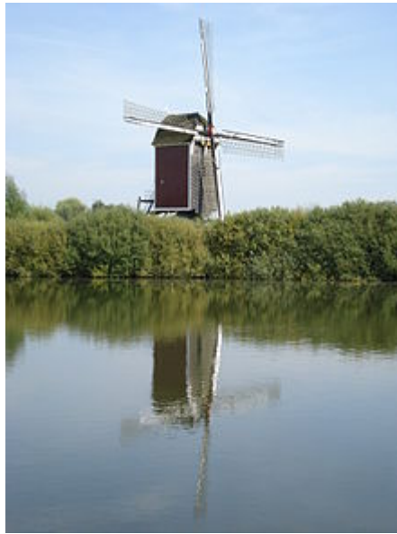
Maasmolen met Molenwiel

In Nederasselt is het Molenwiel ontstaan in de winter van 1739 – 1740 bij dijkdoorbraken