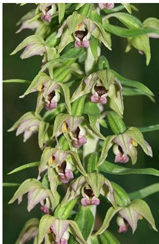
Brede wespenorchis ( Epipactis helleborine ) https://nl.wikipedia.org/wiki/Brede_wespenorchis

https://plantaardigheden.nl/plant/beschr/gonnve/zilverschoon.htm