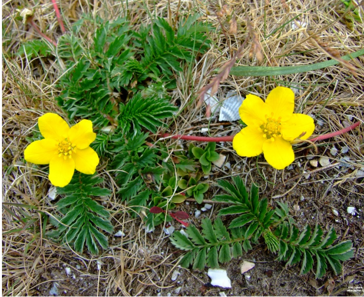
Zilverschoon - Potentilla anserina https://wilde-planten.nl/zilverschoon.htm

Dit kleine plantje hoort van oudsher tot de geneeskrachtige kruiden. Monniken maakten er al tincturen en gorgeldrankjes van. De moderne mens herontdekt de waarde van wilde bloemen.