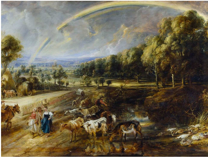
The Rainbow Landscape by Peter Paul Rubens , 1636, via the Metropolitan Museum of Art, New York https://www.thecollector.com/8-dutch-landscape-painters-17th-century/