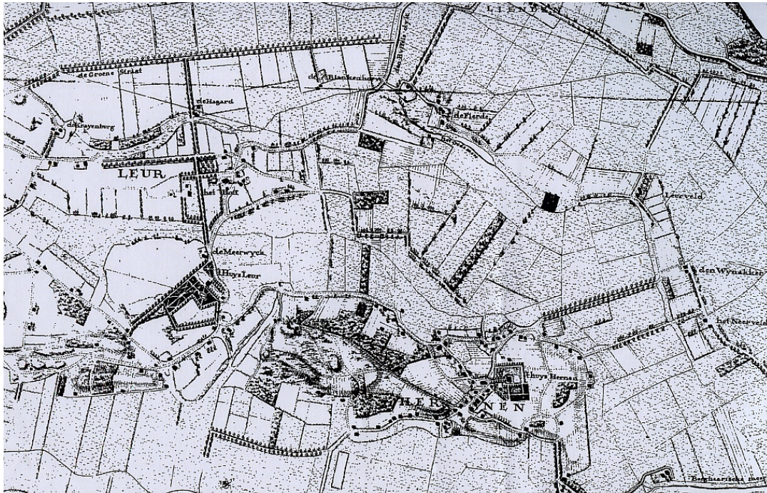
Omgeving Huis te Leur 1800

https://mijngelderland.nl/inhoud/routes/cultuurhistorie-in-het-land-van-maas-en-waal/huis-te-leur