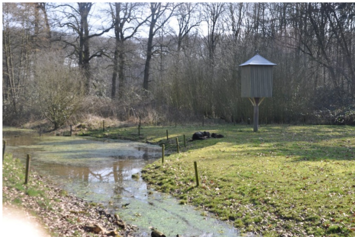
Duiventil bij Huis te Leur

https://mijngelderland.nl/inhoud/routes/cultuurhistorie-in-het-land-van-maas-en-waal/huis-te-leur